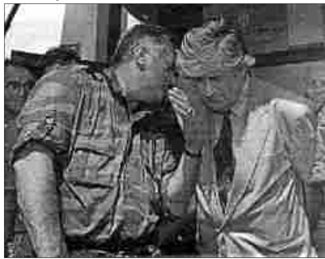
General Ratko Mladini glavna prepreka integracijama

"Trenutno su za Tribunal važno dva imena, gospodin (Veselin) [qivan-ani n, gospodin (Ratko) Mladini, i dok to ne bude rešeno, mi ne možemo ući u Partnerstvo za mir i ne možemo napredovati u procesima integracije onom brzinom kojom smo želili", zaključio je Marović.