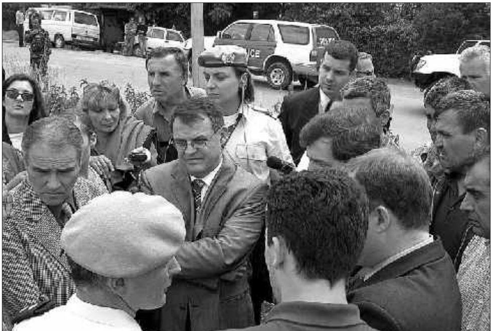
Nebojša Ćović na licemestu

BEOGRAD, 4. juna (Tanjug) - Predsednik Demokratske alternatve (DA) i predsednik Koordinacionog centra za Kosovo i Metohiju Nebojša Ćović otputovao je danas u Obilić, gde je na svirep način ubijena tročlana srpska porodica, saopšteno je iz DA.