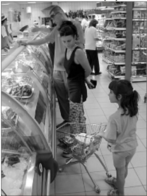
U korpi samo osnovno, slatki i neki drugi put