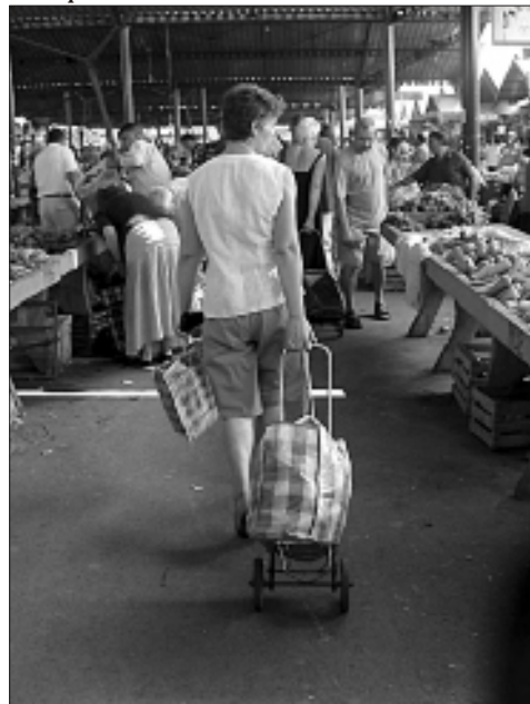
Sva sre}a da je povrje rodi lo, pa cene padaju