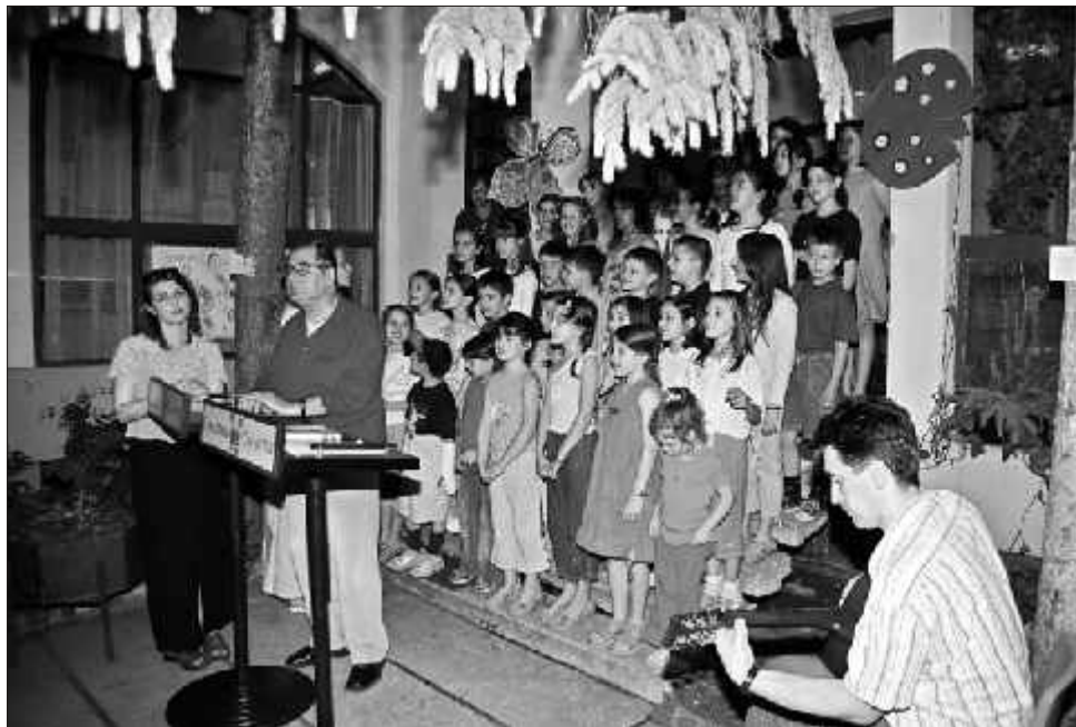
Si no} na ni { avskom keju